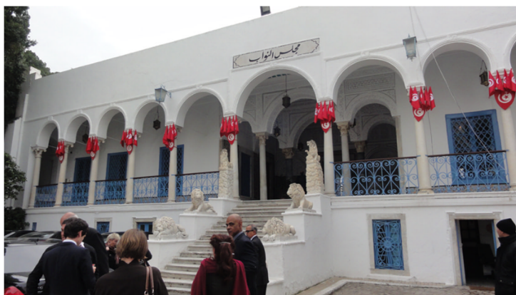
Abbildung 5: Tunesien: historisches Parlamentsgebäude mit der 700 Jahre alten Löwentreppe

Seit 2008 beträgt das Universitätsstudium zwar leider nur noch 3 Jahre, dafür gäbe es aber anschließend einen verpflichtenden zweijährigen Besuch einer Anwaltsschule (ecole des advocats), ohne die niemand zugelassen werden könne.