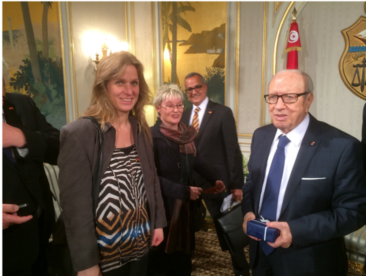
Abbildung 6: Im Gespräch mit Staatspräsident Beiji Caid Essebsi

Anschließend empfängt uns der Staatspräsident persönlich in seinem Dienstsitz. Er nimmt sich mehr Zeit als geplant für uns und macht für seine 87 Jahre einen sehr fitten und aufmerksamen Eindruck. Er legt bei seinen Ausführungen auch einen klaren Schwerpunkt auf die regionale Sicherheitslage.