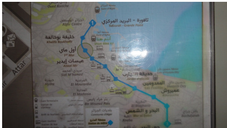
Abbildung 4: U-Bahnplan in Algiers

Am letzten Tag haben wir endlich Gelegenheit die Altstadt von Algiers zu besichtigen.