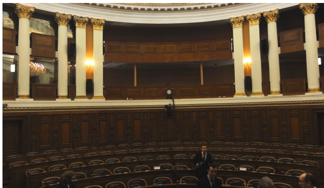
Abbildung 2: Historischer Sitzungssaal des Senats, in dem die Unabhängige Republik Algerien ausgerufen worden ist

Zu den Ursachen des Terrors Anfang der 90er Jahre befragt verweist sie darauf, dass der Terror