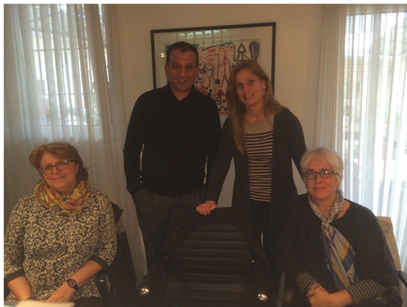
Abbildung 3: Gespräch mit der Welthungerhilfe

Der algerische Staat führt weder eine Prüfung durch, noch erteilt er irgendwelche Bescheide. Eine entsprechende Gesetzgebung soll allerdings in Arbeit sein. (mal wieder)