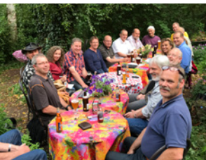
E-MobilistInnen-Stammtisch in Steyerberg

Der nächste Stammtisch findet am 09.08. in Steyerberg statt. Auch im Bundestag haben auf meine Initiative hin einige Abgeordnete Interesse an einem Austausch gezeigt. Mit Beginn der neuen Legislatur wollen wir auch im Parlament ein entsprechendes Netzwerk ins Leben rufen.