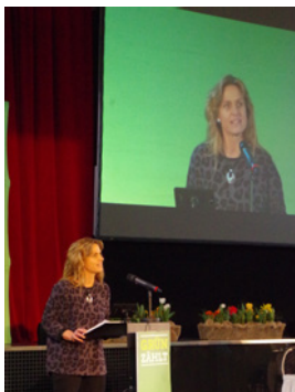
Bei meiner Rede auf der LDK